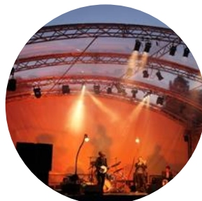
Le "Festinerance", festival itinérant des arts vivants.