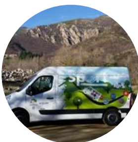
Le "Mobiloscience" qui circule sur le territoire.